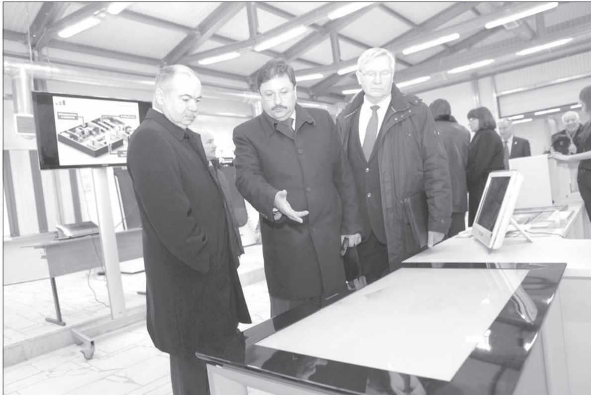
Делегации Совета Федерации были продемонстрированы возможности центра, позволяющие моделировать, изготавливать и внедрять в производство технологические инновации

- Корпус предназначен для подготовки современных инженеров, - подчеркнул ректор УлГУ. - Поэтому мы постарались реализовать здесь современную концепцию подготовки инженеров Европы, пользуясь опытом наших коллег из Чехии и Германии.