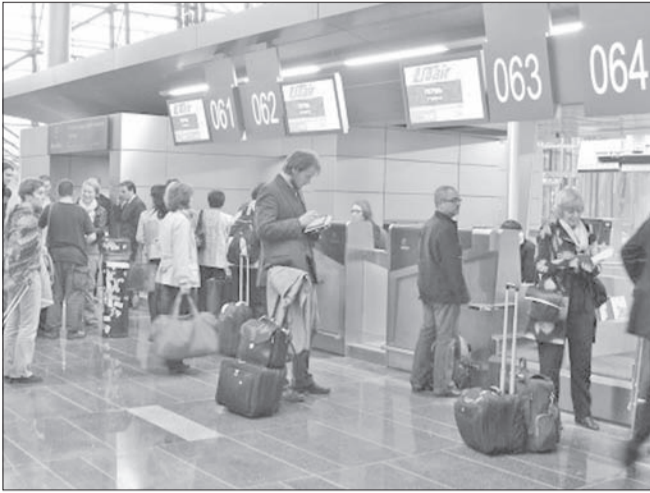
Ульяновский аэропорт обслужил за три месяца свыше 30 тысяч пассажиров. Пассажиропоток увеличился на 25% по сравнению с аналогичным периодом предыдущего года.