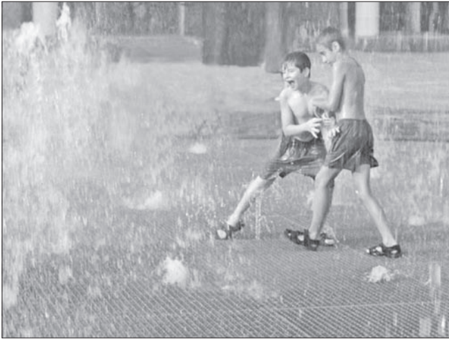
В Ульяновске с 7 мая начнут работать 14 городских фонтанов. Традиционно шесть из них будут бить на Свягие, два - на бульваре Новый Венец.