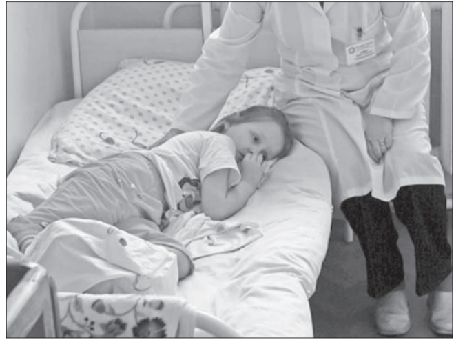
Восемь ульяновских малышей отравились в детском саду села Водорацк Барышского района. Причины произошедшего предстоит выяснить следственно-оперативной группе.