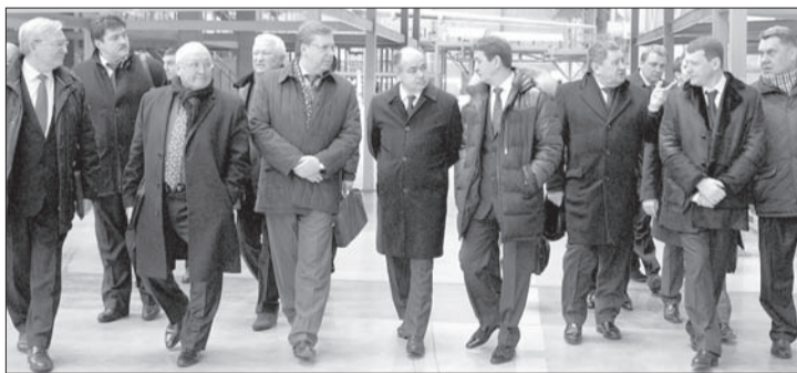
Участники заседания обратили внимание, что в мировой практике выработан ряд мер косвенной государственной поддержки отрасли, которые не попадают под прямой запрет ВТО

Также сказано, что выходу российских авиастроителей на мировой рынок мешает отсутствие таких рыночных преимуществ, как конкурентоспособная продукция, надежность поставок, благоприятные ценовые и финансовые условия