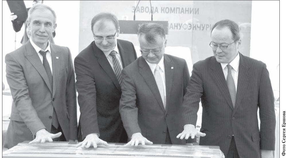
Завод станет первым предприятием японского концерна «Бриджстоун» на территории России и СНГ

Подтвердил его слова министр посольства Японии в России Рокуичиро Мичии: «Уверен, что создание данного завода на территории Ульяновской области будет способствовать не только развитию автомобиль-