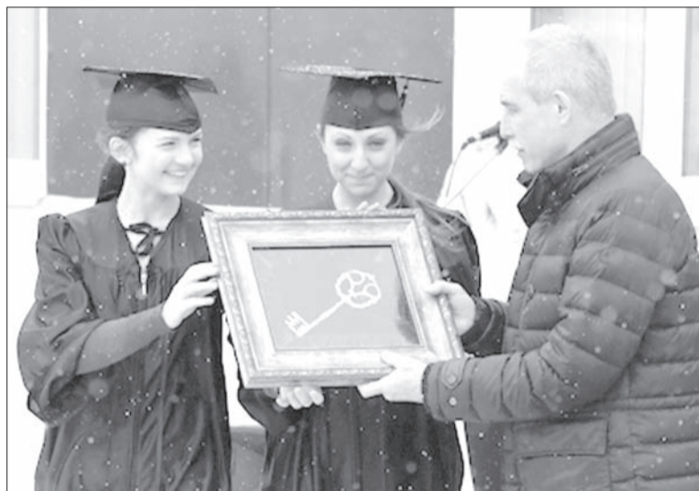
Открывая центр молодежного инновационного творчества, Сергей Морозов передал символический ключ от него студентам УлГУ

- Здесь ребята сами собирают 3D-принтеры, - показывает он