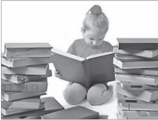
С 1 по 6 апреля в Ульяновской области пройдет более 100 мероприятий, посвященных Международному дню детской книги.