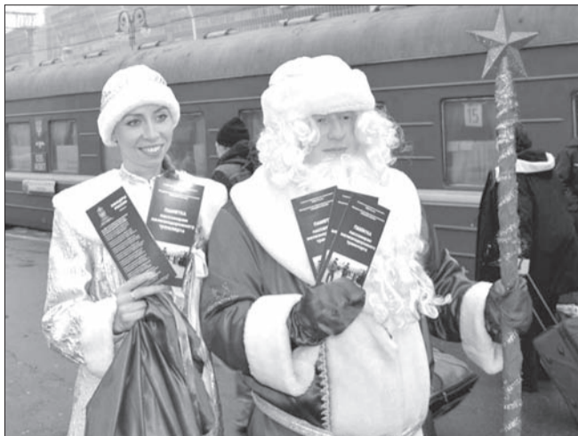
В Ульяновске стартовала акция «Полицейский Дед Мороз», в рамках которой членами Общественного совета УМВД при поддержке сотрудников областной полиции была организована елка для детей, состоящих на учете в подразделениях по делам несовершеннолетних.