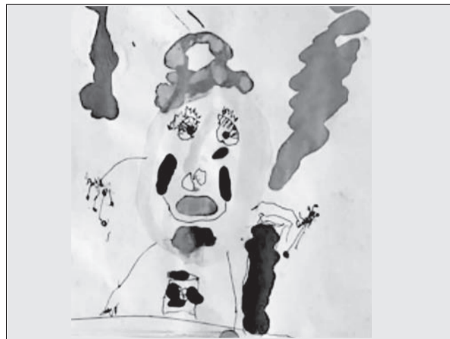
На первой выставке детского рисунка имени Виктора Буяльского «Рисуем жизнь», которая проходила в Пензе и объединила всю страну, Гран-при взял юный художник из Ульяновска. Он получил сертификат на 10 тысяч рублей. Основная тема - портрет творческой личности.