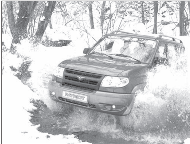
↑ Легковой автомобиль УАЗ-3163 (UAZ Patriot) признан лауреатом 16-го Всероссийского конкурса «100 лучших товаров России» в номинации «Продукция производственно-технического назначения» по итогам 2013 года.