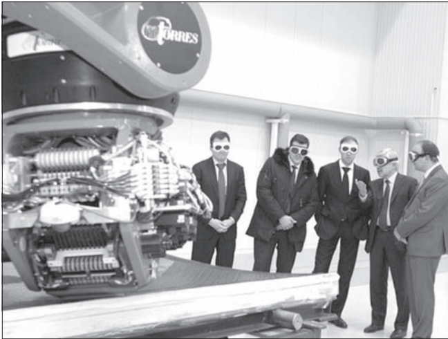
↑ Специалисты Всероссийского НИИ авиационных материалов (ВИАМ), а также представители Минпромторга РФ приняли участие в торжественной церемонии открытия первой очереди производства «АэроКомпозит», он станет самым крупным композиционным производством в отечественном авиапроме.