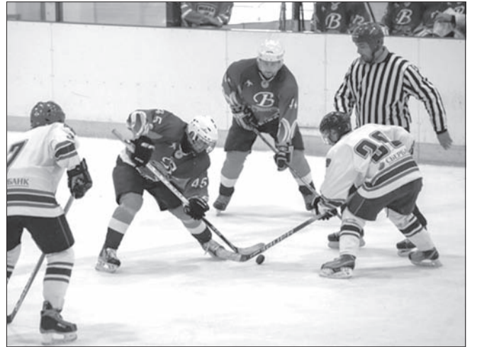
↑ Товарищеский хоккейный матч между ульяновскими командами 31-й гвардейской дивизии ВДВ и «Шквал» УФСИН состоялся на льду хоккейного корта, открывшегося в 31-й гвардейской отдельной десантно-штурмовой бригаде. Коробку для корта десантникам подарили еще в прошлом году.