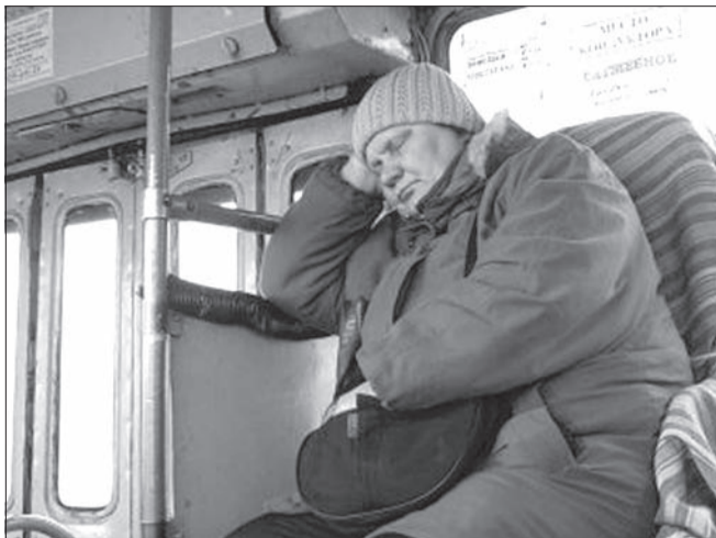
С 24 декабря стоимость проезда в общественном транспорте категории «МЗ» (автобусы ЛИАЗ) выросла с 13 рублей до 15 рублей. Цены на проезд в маршрутках пока оставляют прежними - 16 рублей.