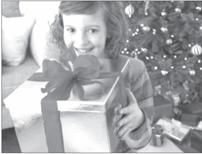
Более 35 тысяч ульяновских ребятишек будут обеспечены новогодними подарками в 2013 году. По месту работы родителей на предприятиях и организациях города также планируется закупка 21704 подарков для детей сотрудников в возрасте от полутора до семи лет.