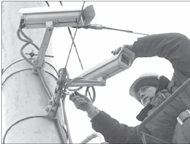
↑ В рамках реализации проекта «Безопасный город» во дворах города функционирует уже более 50 систем видеонаблюдения по 27 адресам. Камеры позволяют следить за состоянием дворовых территорий, подъездов жилых домов, парковок автотранспорта.