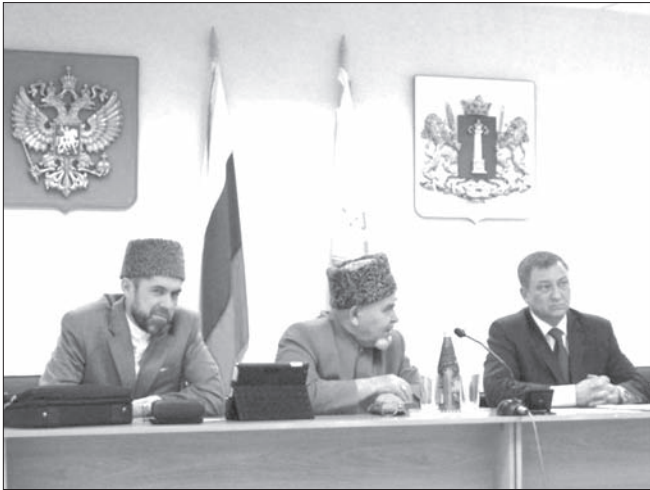
↑ В Ульяновске обсудили проблемы осужденных мусульман. Сегодня в учреждениях УИС Ульяновской области отбывают наказание более 800 осужденных, исповедующих мусульманскую веру. Это составляет более 1,0% от общего количества осужденных.