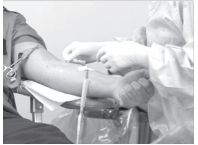
Станция переливания крови делает запасы на зимние праздники. Прием будет организован 31 декабря с 8.00 до 12.00 по адресу: ул. 3-го Интернационала, 13/96. Также учреждение будет работать 4 и 5 января с 8.00 до 13.00.