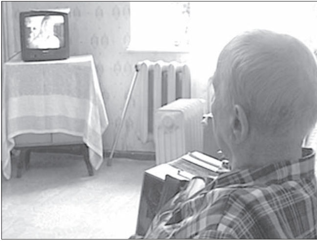
В 2013 году 613 ульяновских ветеранов ВОВ получили сертификаты на жилье. Из федеральной казны в региональный бюджет на эти цели поступило 592,6 млн рублей. Новые квартиры уже приобрели 602 человека.