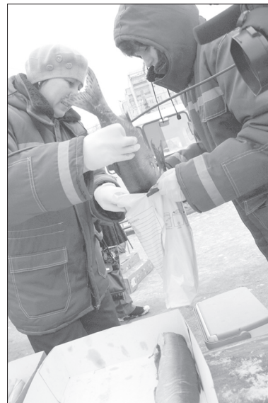
...и 10 килограммов копченой рыбы

- Согласно положению о некачественных продуктах и федеральному закону о качестве и безопасности продукта, если на продукцию отсутствуют документы, подтверждающие безопасность, и маркировка, где прописан про-