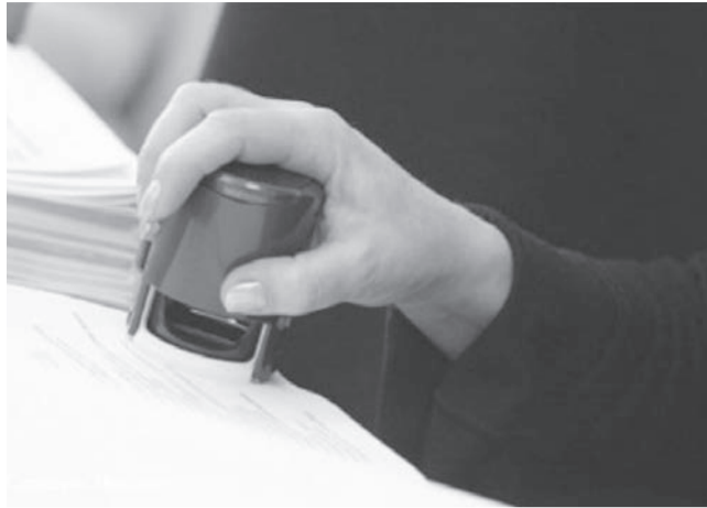
↑ В следующем году в России отменяют применение круглых печатей в деятельности компаний. При регистрации предприятий не надо будет тратиться на изготовление каких-либо штампов.