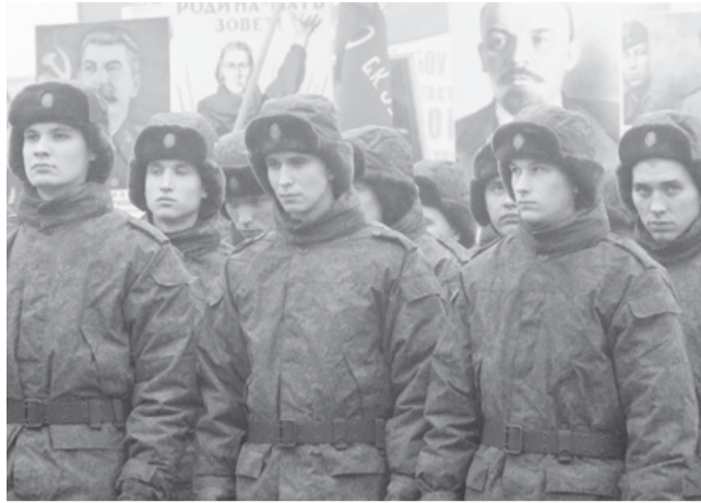
40 ульяновских призывников прямо с парада 7 ноября отправились для прохождения военной службы в Таманскую и Кантемировскую дивизии. Большинство из них будут участниками парада на Красной площади в Москве 9 мая 2015 года.