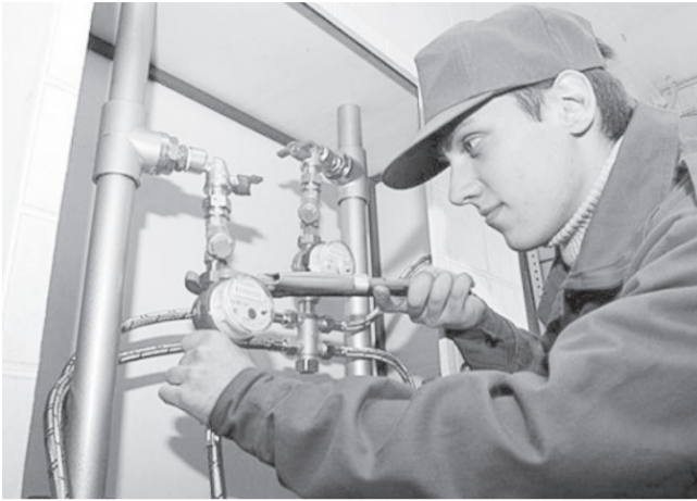
До конца года в области осталось установить 1176 приборов учета холодного (ХВС) и горячего (ГВС) водоснабжения и тепловой энергии, а также 315 приборов учета расхода электроэнергии.