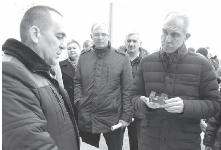
Земельный участок для реализации проекта инвестору помогли подобрать в Центре развития предпринимательства Майнского района

Если в строительство первой очереди проекта инвестор вкладывает собственные средства, то для реализации второй очереди надеются привлечь заемные средства. Таким образом, общий объем инвестиций должен составить 130 млн рублей. Руководитель компании признается - в нынешней экономической ситуации инвестировать в новое производство рискованно, однако расширение производства требует времени. Экономические расчеты показывают,