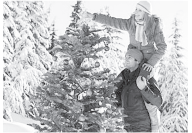
Две трети россиян за то, чтобы сделать 31 декабря выходным днем. Россиянам куда важнее день перед Новым годом, чем ночь после Рождества. По данным Исследовательского центра портала Superjob, большинство согласны работу начинать уже 8 января.