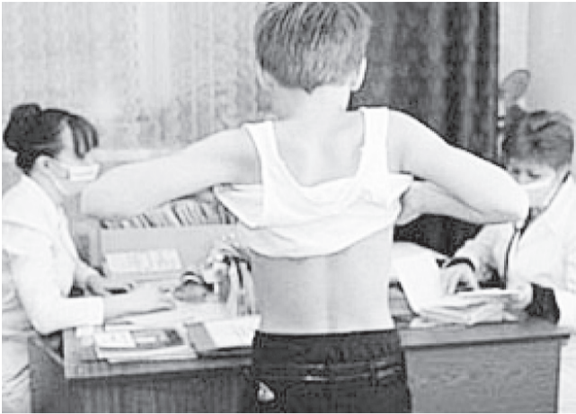
↑ В 2014 году диспансеризации подлежат 208 тысяч жителей Ульяновской области. Вся необходимая вакцина закуплена в полном объеме.