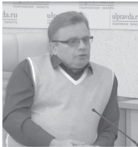
«сталинки», панельные дома - какие из этих типов жилья наиболее требуют капитального ремонта?

- Если подходить к этому вопросу строго формально, то понятно, что чем старше дом, тем более он требует ремонта, особенно при