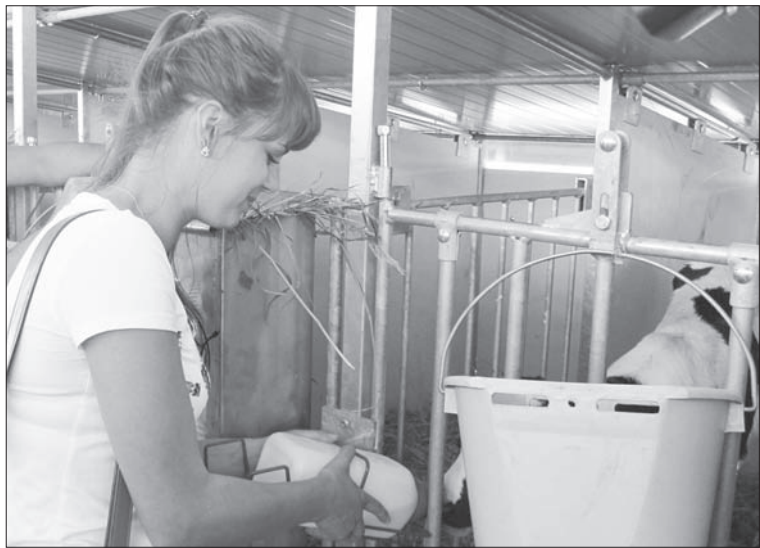
Журналистам разрешили попоить телят. Едва удержишь бутылочку!

Уже вместе с губернатором мы открыли новый телатник «Джузеппе», где нам разрешили попоить телят. Те, почуяв халяву, тянули из сосок так, что едва удавалось удержать бутылку. Губернатор, кстати, здесь сделал фото теленка, чтобы показать дочкам. А в это время у буренок шла дойка... под музыку Шопена. Причем это была не показуха. Оказывается, каждая дойка сопровождается классикой. Не жизнь, а песня.