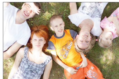
«Бронза» моторного завода.

Сам конкурс состоялся 26 мая. Он вклю- чал в себя игру с фотозаданиями и был посвящен Дню защиты детей. Все его задания были связаны с темой детства, семьи, материнства. Ведь дети — это воплощение наших родительских неосу- ществленных желаний и надежд, мы желаем воспитать своего ребенка так, чтобы он добился большого успеха в своей жизни. Дети — лучшее, что есть в нашей жизни.