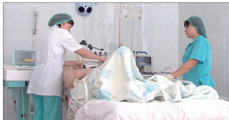
Палата реанимационного отделения.

Главной задачей конференции в Димитровграде является обмен опытом с коллегами из медицинских учреждений ФМБА России, Ульяновской области и других регионов. Научно-методический материал, который будет представлен научными работниками и практическими врачами Москвы, Красноярска, Перми, Сарова, Саратова, Новоуральска, Петрозаводска, Казани, Дзержинска, Удомли, Северска, Оренбурга, Самары, Тольятти, Ульяновска и других городов, позволит в ближайшем будущем внедрить современные медицинские технологии по оказанию неотложной помощи населению Димитровграда. Знания, полученные врачами и медицинскими сестрами на конференции, принесут свои плоды в виде спасенных жизней.