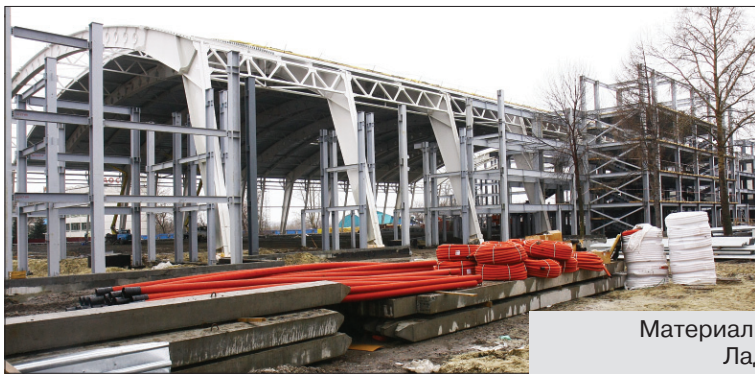
Материалы страницы подготовила Лада БЕЛОЗЕРОВА.

Требования к конкурсному предложению: нестандартность, новизна, оригинальность, краткость, удобство в произношении и написании. Первый этап конкурса длился с 25 марта по 15 мая. А с 31 мая по 1 сентября в сети Интернет будут выложены лучшие из предложенных вариантов. То название, за которое проголосует большинство любителей хоккея, и станет «именем» Ледового дворца.