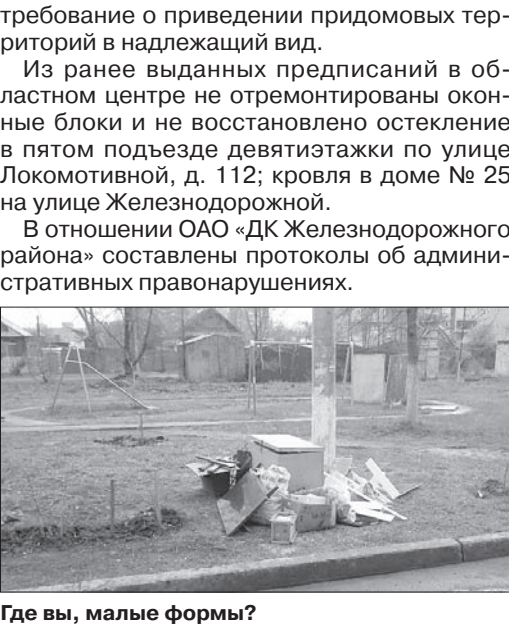
Где вы, малые формы?

В Ульяновске нарушения выявлены по улицам Кольцевой, д. 36, 38, 40 (не скошена трава); Варейкиса, д. 45 (отсутствуют урны и скамейки); Карла Либкнехта, д. 32 (до сих пор не проведен ремонт малых архитектурных форм, срок работ истек еще 14 мая). В Димитровграде малые формы остались незамеченными на улицах Баданова, д. 79, 79а, 81, 86а, 86б, Алтайской, д. 55, 49, 51, Восточной, д. 20, 38, 20а, 22, 36, 34, 40, Черемшанской, д. 85, 87, 91, 93, 114, 116, 118, 120, 122, 130, 124 (везде не установлены скамейки, не сделаны ремонт и покраска урн, не выполнены покраска, выравнивание и ремонт стоек для ковров, белья). Управляющим организациям направлено