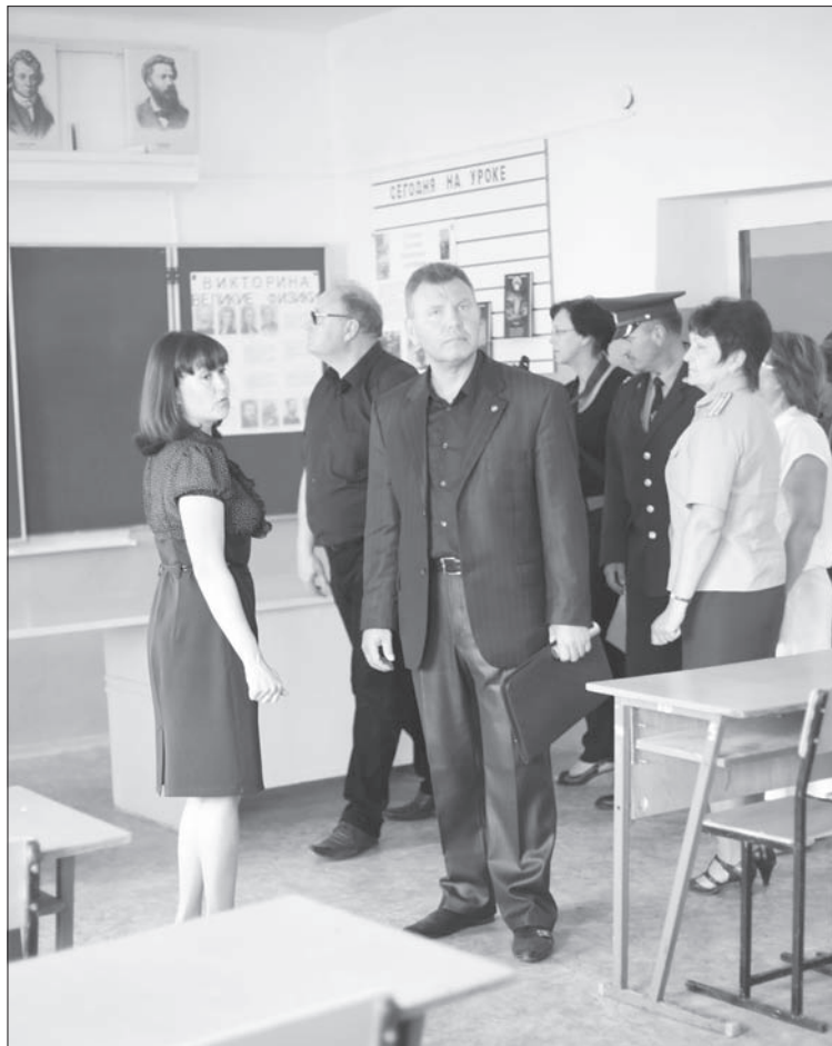
...А ведь в колониях еще и учатся!

это значит, что грош цена всей нашей работе.