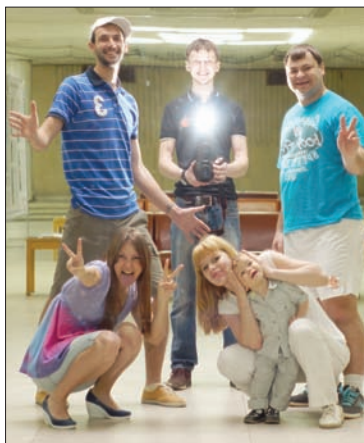
«Серебро» механического заво- да.

Организатором фотомарафона выступил департамент моло- дежной политики министр- ства внутренней политики Улья-