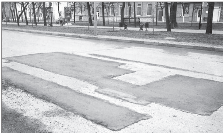
Образец того, как не надо делать дорожный ремонт.

На этой неделе в Ульяновске прошел практический семинар