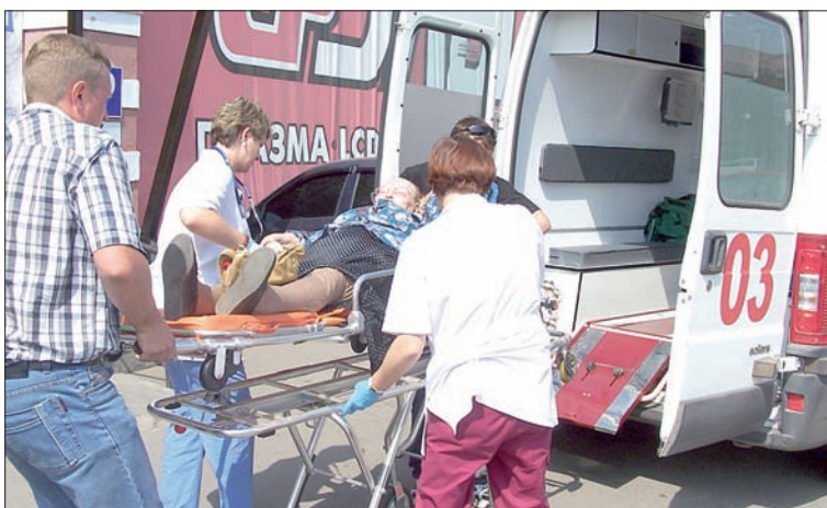
Работа бригады скорой помощи.

Приемное отделение многопрофильного стационара (МПС) № 1, располагающееся в Западном районе города, оказывает круглосуточную неотложную помощь всем гражданам — как обратившимся