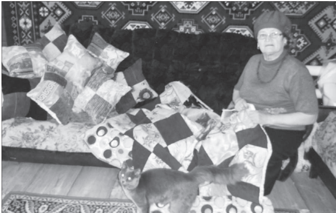
Когда под руки попался мешок с лоскутками, ей пришла идея начать шить наволочки для подушек, затем стала шить покрывала из лоскутков.

— Продавцы стали жаловаться, что в магазин из райцентра