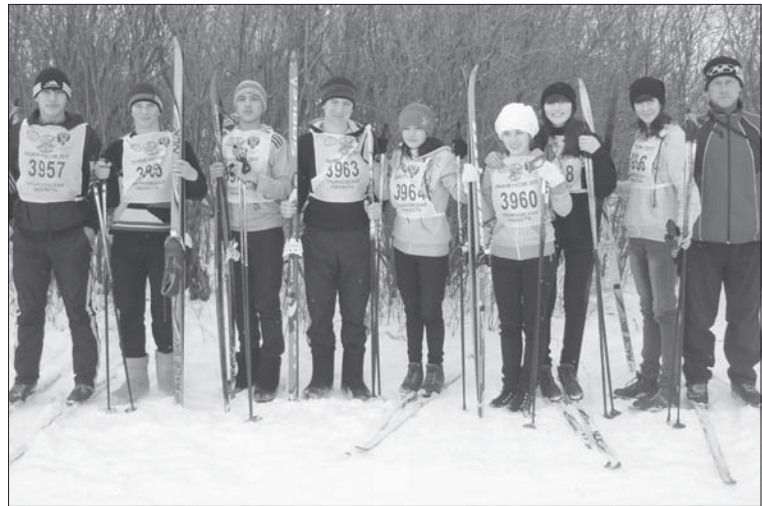
Команда в сборе.