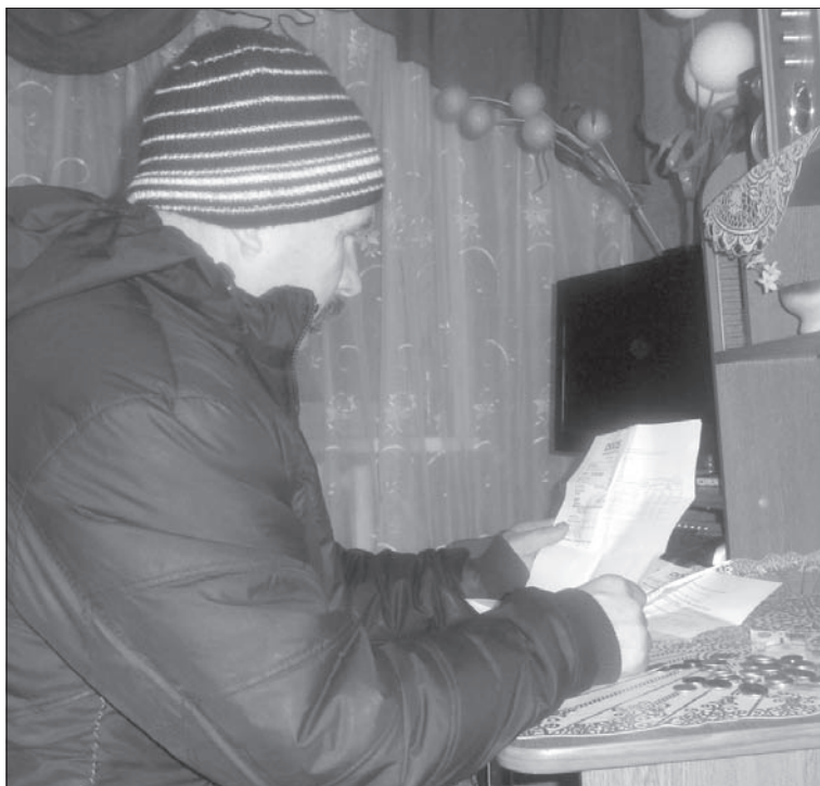
Жилищные субсидии помогут оплатить «коммуналку».

Всего же в течение 2012 года пользовались субсидиями на оплату ЖКУ 949 старокулаткинских семей, компенсациями — 252 семьи и одиноко проживающих граждан. Для сравнения следует отметить, что за 2011 год субсидиями на оплату ЖКУ воспользовались 1022 семьи, компенсациями — 288 се-