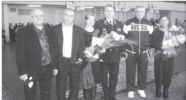
Родители погибших сотрудников с руководством УМВД.

Организаторы соревнования — областная федерация борьбы «Керешу», областной департамент по физической культуре и спорту, УВД, Цильнинская районная администрация — благодарят спонсоров мероприятия.