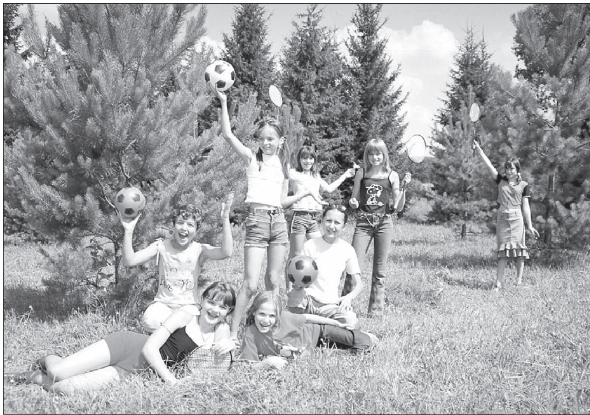
В прошлом году 530 детей отдохнули в лагерях, финансируемых за счет средств областного бюджета.

Сразу же после зимних каникул началась заявочная кампания в загородные оздоровительные лагеря Ульяновской области с учетом возмещения стоимости путевки из областного бюджета. То есть родители и в наступившем году вновь