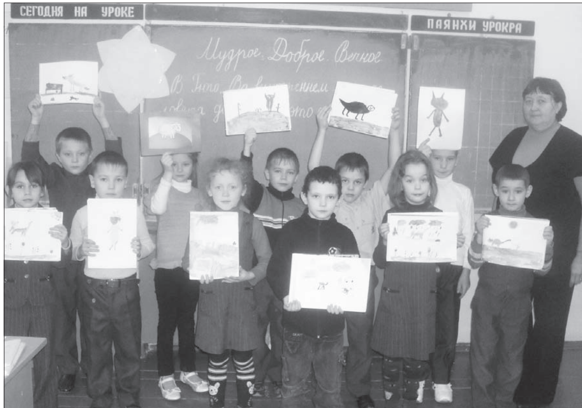
После учебы дружно отдыхаем.

тоже остается: путешествие и прогулки в лес позволяют восстановить силы для постижения новых знаний.