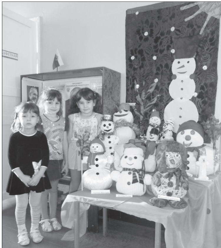
Конкурс снеговиков вызвал у ребят много эмоций.

Надо отметить, что подобного рода конкурсы здесь проводятся регулярно на протяжении вот уже пяти лет. И каждый раз — это новая тематика. К примеру, в позапрошлом году поделки посвящались зеленой красавице елке. В прошлом году на конкурс «Новогодняя игрушка нашей семьи» было представлено немало работ, в частности, одна из семей смастерила зайчика из простых