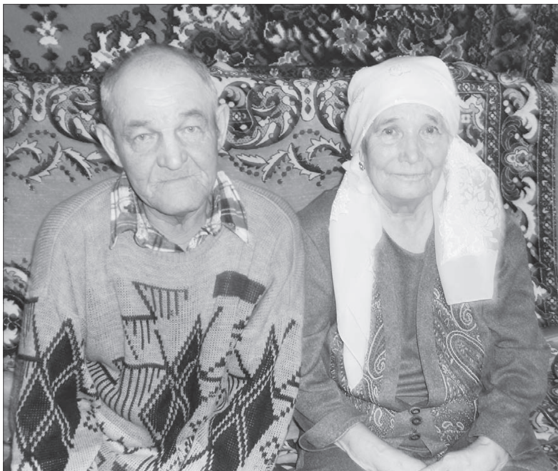
Супруги Ханбиковы вместе много лет.

брат выполнял мужскую работу вместе с отцом, а она своими маленькими ручками варила, стирала, убиралась.