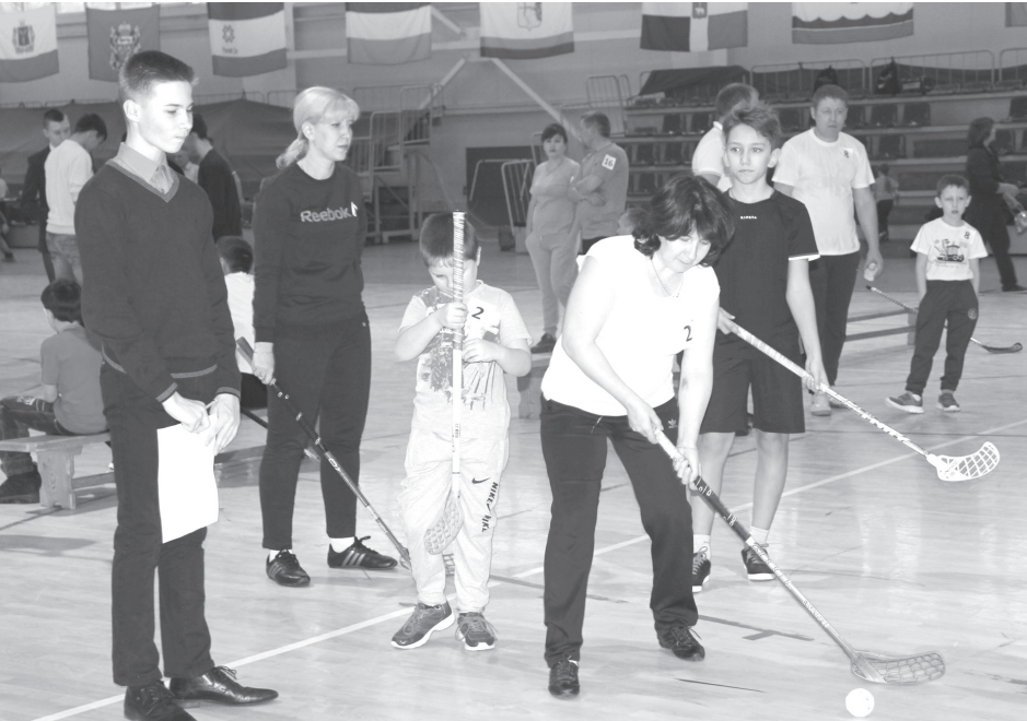
Теперь и женщины знают, что такое флорбол и как в него играть?