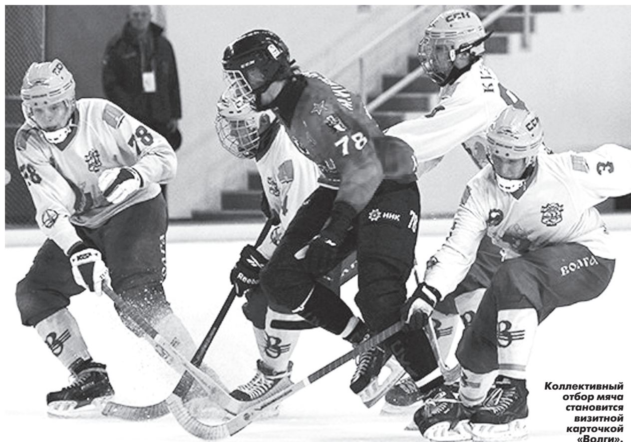
Коллективный отбор мяча становится визитной карточкой «Волги».

Материалы 2 и 3 полосы подготовил Максим СКВОРЦОВ.