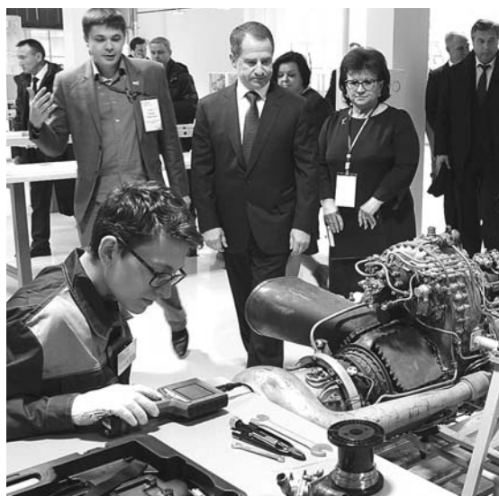
В рамках рабочей поездки в Ульяновск Михаил Бабиш посетил авиационный колледж, где осмотрел площадки рабочих профессий Межрегионального центра компетенций WorldSkills.

Конституцией республики определяют самостоятельно в соответствии со своим законодательством. У нас 22 республики, в 21 введены государственные языки помимо русского. Но в соответствии с Конституцией РФ единственным языком Российской Федерации является русский язык. Никто никогда в Российской Федерации не запрещал изучение родных и государственных языков... Я вам сейчас скажу новую информацию, но она крайне важна. Анализ международного законодательства показал, что ни в одной стране мира (мы проанализировали все государства со сложным федеральным устройством, где есть регионы, губернии,