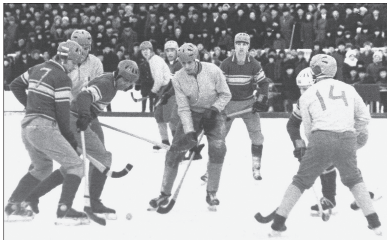
Боевой задор ульяновской «Волги» привлекал болельщиков многих городов СССР

Отметился легендарный голедор и в «российской» летописи «Волги». Но это уже другая история. Ее продолжение - в следующих номерах.