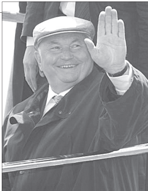
Юрий Лужков проведет в Ульяновске пленарное заседание в режиме онлайн

Планируется, что на сессии в Ульяновске в ряды Ассамблеи будет принят город Орел. «Вступление Орла в МАГ станет хорошим сти-