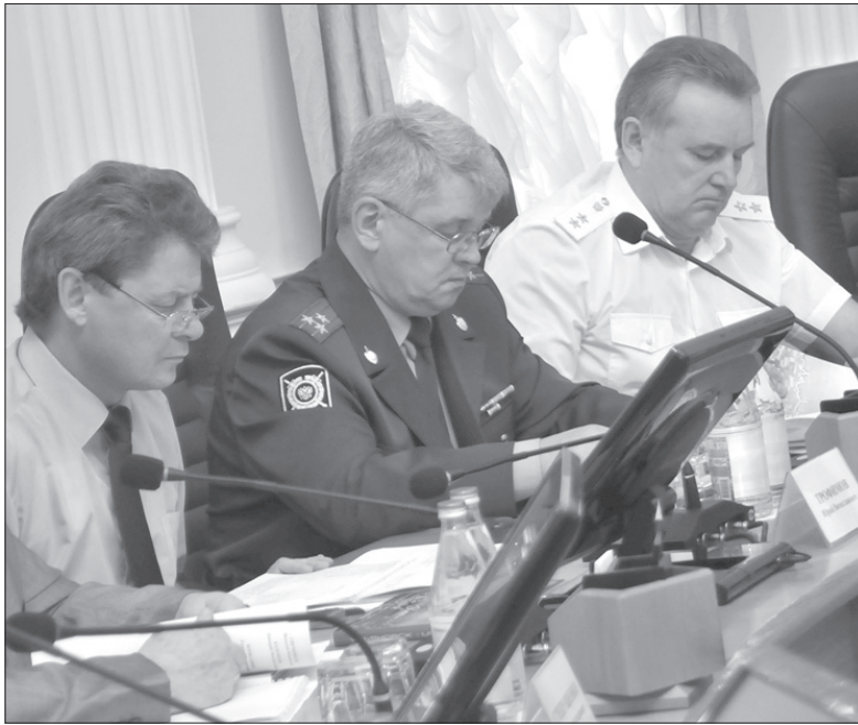
Законопроект «О полиции» обсуждают и люди в погонах, и те, кого они обязаны защищать

- Никакая реформа не заставит сотрудников МВД работать нормально, пока они получают 10-15 тысяч рублей. Думаю, что, разрабатывая в дальнейшем законопроект о социальных гарантиях сотрудникам полиции, было бы правильным установить должностные оклады вне зависимости от звания, а по виду службы. Тогда и необходимость в погоне за «погонами» сразу отпадает. Второе предложение: сделать заработную плату кратной уровню прожиточного минимума в конкретном регионе, опять-таки в зависимости от вида службы. Важно и не забыть ветеранов МВД и обеспечить «конвертацию» их пенсионного обеспечения в соответствии с той системой, которая будет в после-