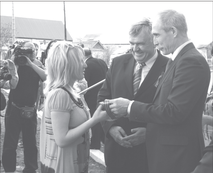
Сергей Морозов вручил ключи от квартир молодым врачам Большенаягаткинской больницы.

Осмотрев отремонтированную поликлинику, глава региона отметил, что теперь она несколько не уступает, а в чём-то даже превосходит лечебные учреждения Ульяновска, но всё же подчеркнул, что реконструкция Большенаягаткинской районной больницы не завершена. В связи с этим он заявил, что региональное правительство готово выделить Цильнинскому району необходимую сумму для того, чтобы привести в достойное состояние и стационар, однако муниципальные власти в