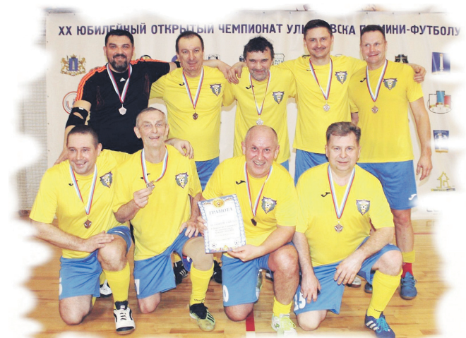
В отличие от «Ульяновска» и «Симбирска» футболистам «Волги» хватило 14 игр, чтобы завоевать «бронзу».

14-й тур (26 февраля, ФОК «Фаворит»): «Ульяновск» - «Симбирск» - 2:0 (2:0), «Новый город» - «Китеж» - 2:5 (1:3), «Север» - «Бриг» - 0:0, «Динамо» - «Волга» - 1:3 (1:1).