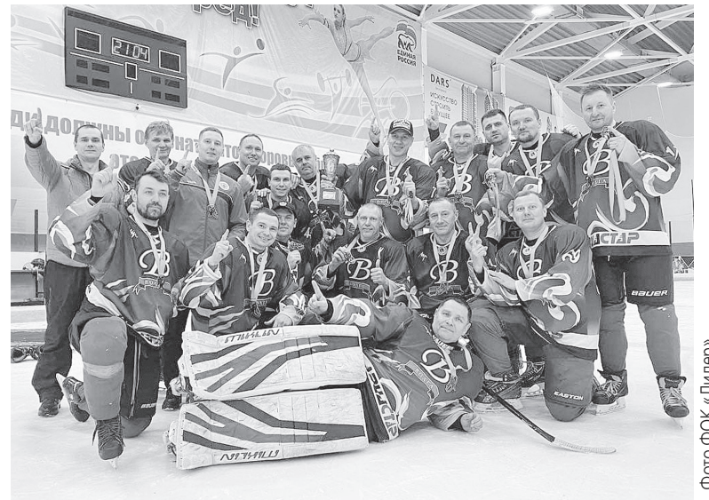
Хоккеисты «Волги» с чемпионским трофеем.

Кульминация турнира состоится 13 марта в ФОКе «Лидер», где «Олимп» и «Барс» поспорят за