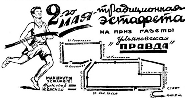
Маршрут эстафеты был размещен в номере «Ульяновской правды» за 1 мая 1947 года.