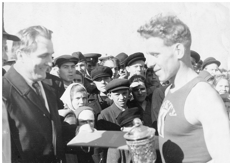
В самых первых эстафетах успех сопутствовал легкоатлетам гвардейского танкового училища.