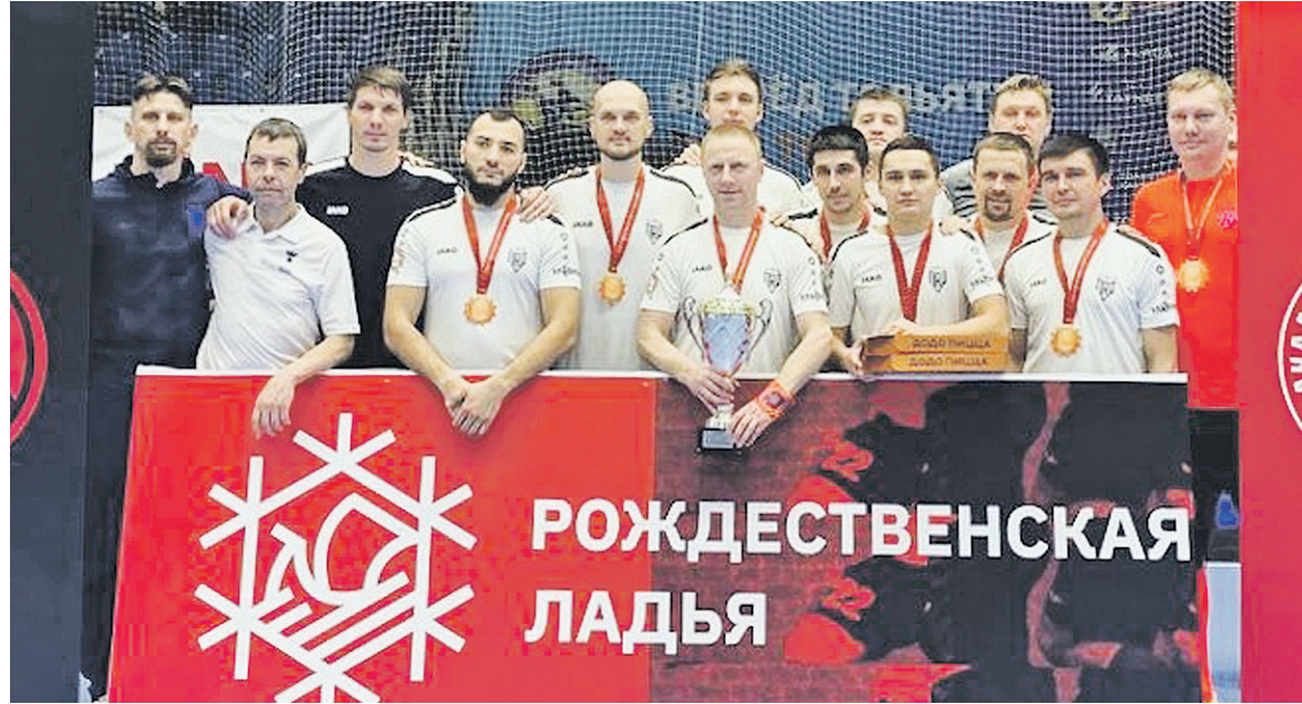
После четырех побед подряд «Погода в доме» впервые стала бронзовым призером традиционного турнира «Рождественская Ладья».

На старте плей-офф «Погода в доме» встречалась с еще одной местной командой - «Локо-ЭкоВоз». За основное время соперники не сумели распечатать ворота друг дру-