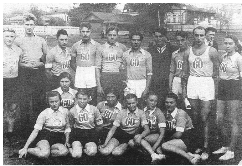
Бегуны спортивного общества «Большевик» побеждали в общекомандном зачете в 1949-1950-х годах, завоевывая переходящий приз редакции газеты «Ульяновская правда».