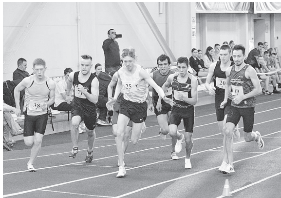
На беговых дорожках - плотная борьба.

Мемориал неизменно проводится с 2016-го и за это время обрел статус межрегионального. Призовой фонд в размере 100 тысяч рублей не первый год привлекает участников из других регионов страны. На сей раз побороться за медали на дистанциях 800, 1 500 и 3 000 метров приехали гости из Татарстана, Чувашии, Марий Эл, Дагестана, а также Саратовской и Пензенской областей.