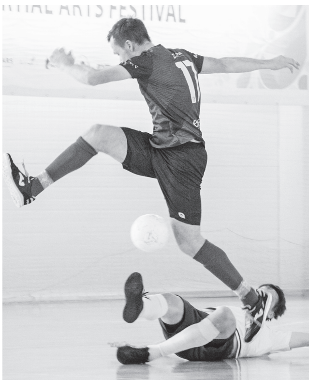
В матче «Погода в доме - Кучина» было немало эффектных моментов на игровой площадке.

- Нас подвела реализация: моментов создали много, но не забивали даже с «ленточки» ворот, в концовке стали нервничать из-за того, что не получается забить, потеряли концентрацию и «Кучина» этим воспользовалась, - резюмировал поеди-