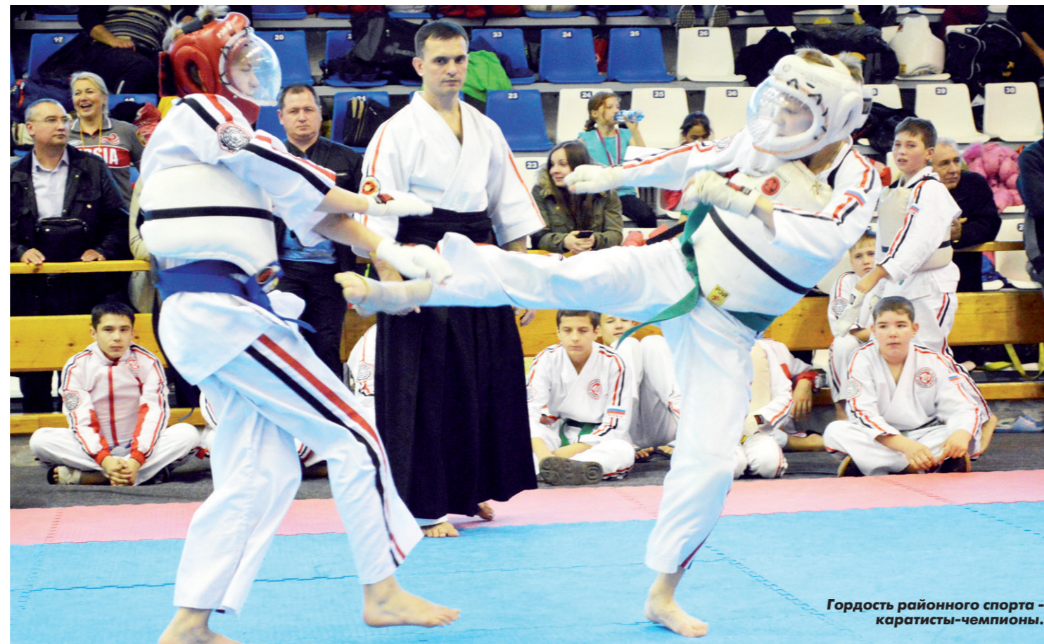
Гордость районного спорта - каратисты-чемпионы.

«ЧЕМПИОН» продолжает обзорное путешествие по 73-му региону с целью узнать, как обстоят дела с физкультурой и спортом за пределами Ульяновска - в ближних и дальних районах области.