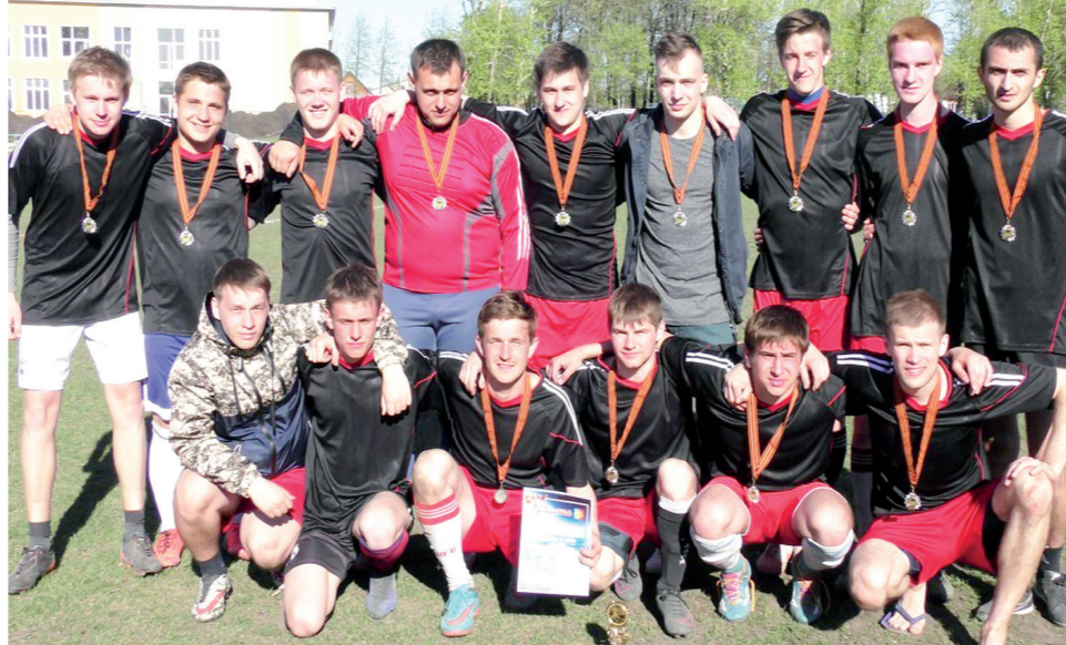
Футбольное «сегодня» кузоватовского футбола - игроки команды «Посад».