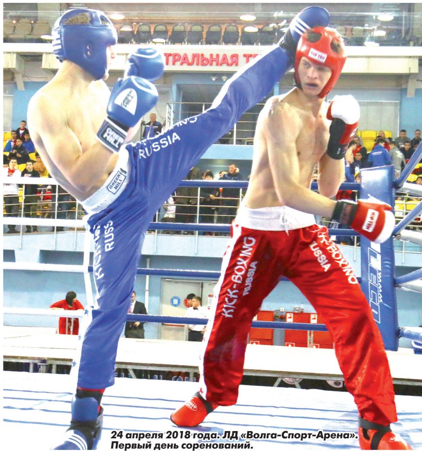
24 апреля 2018 года. ЛД «Волга-Спорт-Арена». Первый день соревнований.