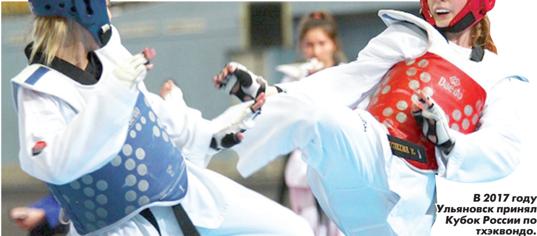
В 2017 году Ульяновск принял Кубок России по тхэквондо.