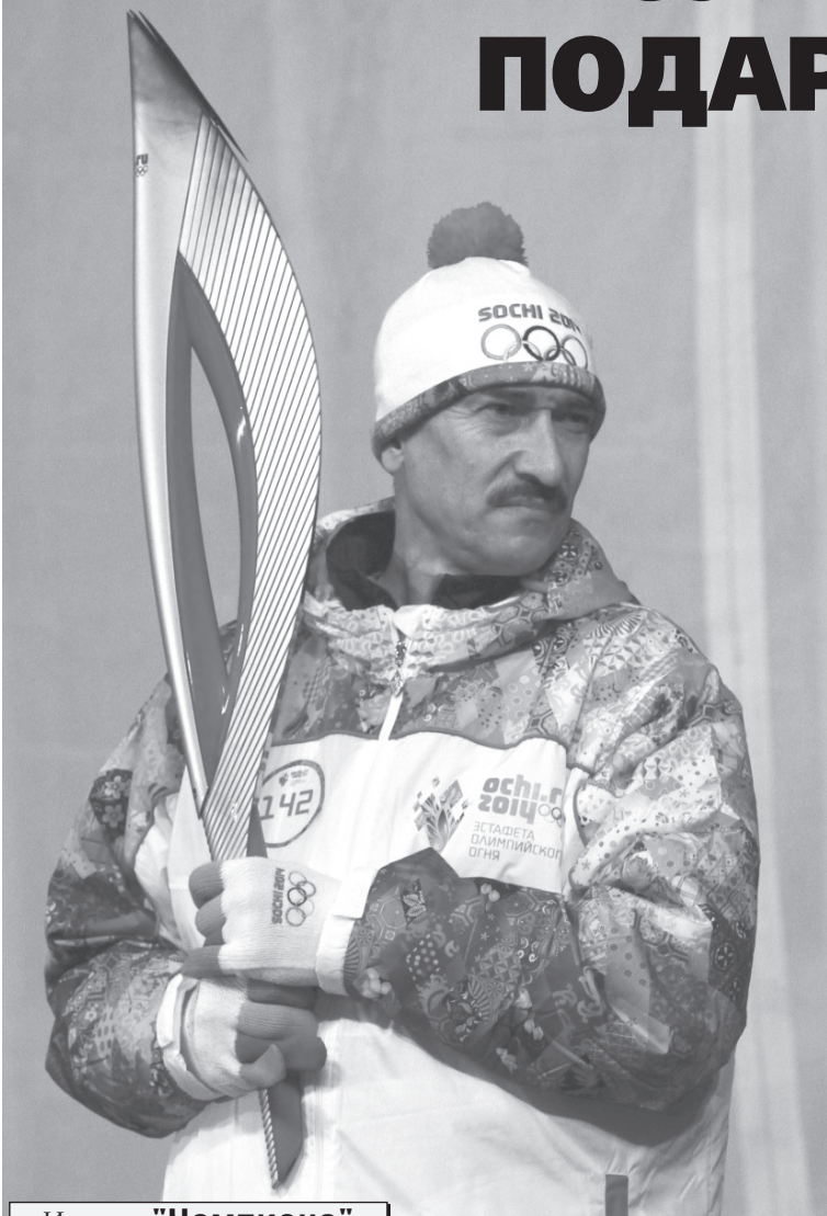
Из досье "Чемпиона"

Владимир КРЫЛОВ, заслуженный мастер спорта Родился 26 февраля 1964 года в Сенгилее Ульяновской области. Заслуженный мастер спорта. Олимпийский чемпион 1988 года. Победитель легкоатлетической эстафеты 4x100 метров. Чемпион Европы 1986 года в Штутгарте. Серебряный призер чемпионата мира 1987 года в Риме. Неоднократный чемпион СССР. Действующий обладатель рекорда России на дистанции 200 метров. Почетный гражданин Ульяновской области.